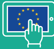
Схема за уседналост на граждани на ЕС: съдействие за граждани на ЕС, ЕИП и Швейцария.

Консултации, свързани със задължията и парични средства: помощ и съдействие за хората, които се затрудняват при управлението на заемите си.